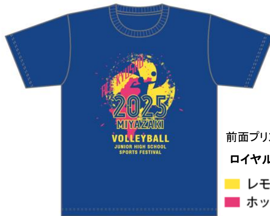
前面プリントデザイン