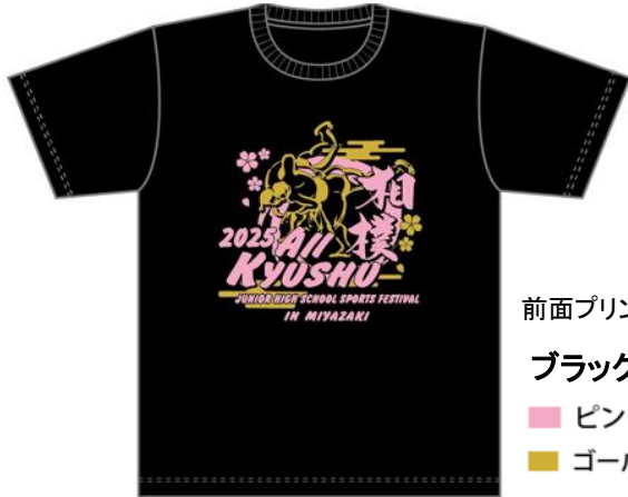
前面プリントデザイン ブラックTシャツ ■ ピンク ■ ゴールド

九州大会開催記念Tシャツの販売を下記の通りご案内します。 チーム活動の記念にぜひご購入ください。下記ご注文方法でインターネット専用WEBサイトからお申込みください。