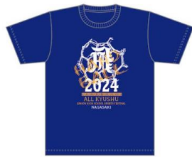
ジャパングルーン